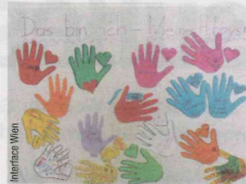
„SOWIESO MEHR!“ hat 1.000 Kursplätze.

Kanufahren oder Museumsbesuch: Wer am Vormittag seine Deutschkenntnisse verbessert, wird am Nachmittag mit einem tollen Freizeitange-