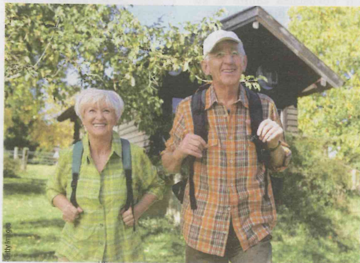
Wandern, schwimmen, reiten: Mit dem Urlaubsangebot der Pensionistenklubs Österreich erleben.

Speziell für KurzurlauberInnen bieten die Pensionistenklubs in den Monaten Juli und August auch Ausflüge in und rund um Wien an. So kann man laue Sommertage in Erholungsgebieten wie Würnitz oder Laaben verbringen. ■ Telefon 01/313 99-170112, www.pensionistenklubs.at